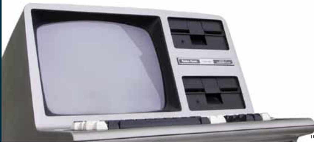
TRS-80 Model III

l'association. Les généreux mécènes se verront remettre un document attestant des linéaires et marques qu'ils auront aidé à installer.