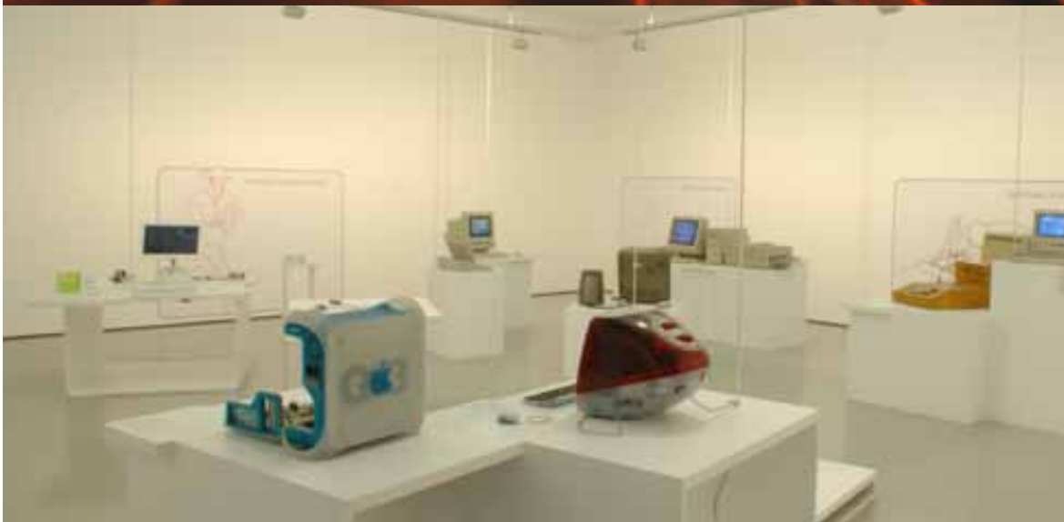
Expo sur le design Apple au Musée d'Art Moderne de Saint-Etienne en 2005

Une cotisation annuelle permet d'affirmer son implication, pour bien marquer la participation. Les suppléments sont appréciés, car Silicium ne vit que par ses membres. L'argent sert au fonctionnement, aux projets et aux manifestations.