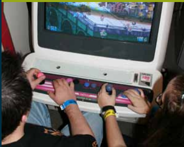
Toulouse Game Show 2008

Très souvent, les membres possèdent des machines qui leur tiennent à cœur. Logiquement, ils les mettent à disposition, pour des études ou des expositions. L'association peut ainsi puiser dans un fonds encore plus complet. Cette dimension supplémentaire offre le plaisir de faire sortir des cartons son propre matériel pour le collectif.